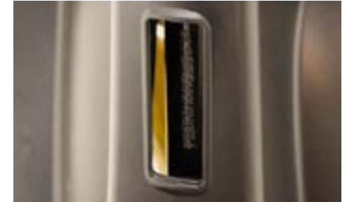
Chassinummer är stämplat på ramen framför förararen.

Vid en trafikkontroll kan du bli ombedd att uppge chassi och/eller motornummer.