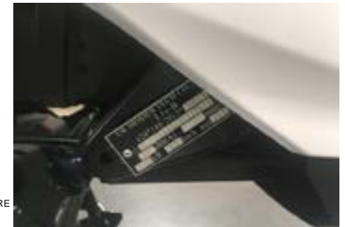
Fordonsidentifikationen är stansad vid bakaxelinfästningen på vänster sida.